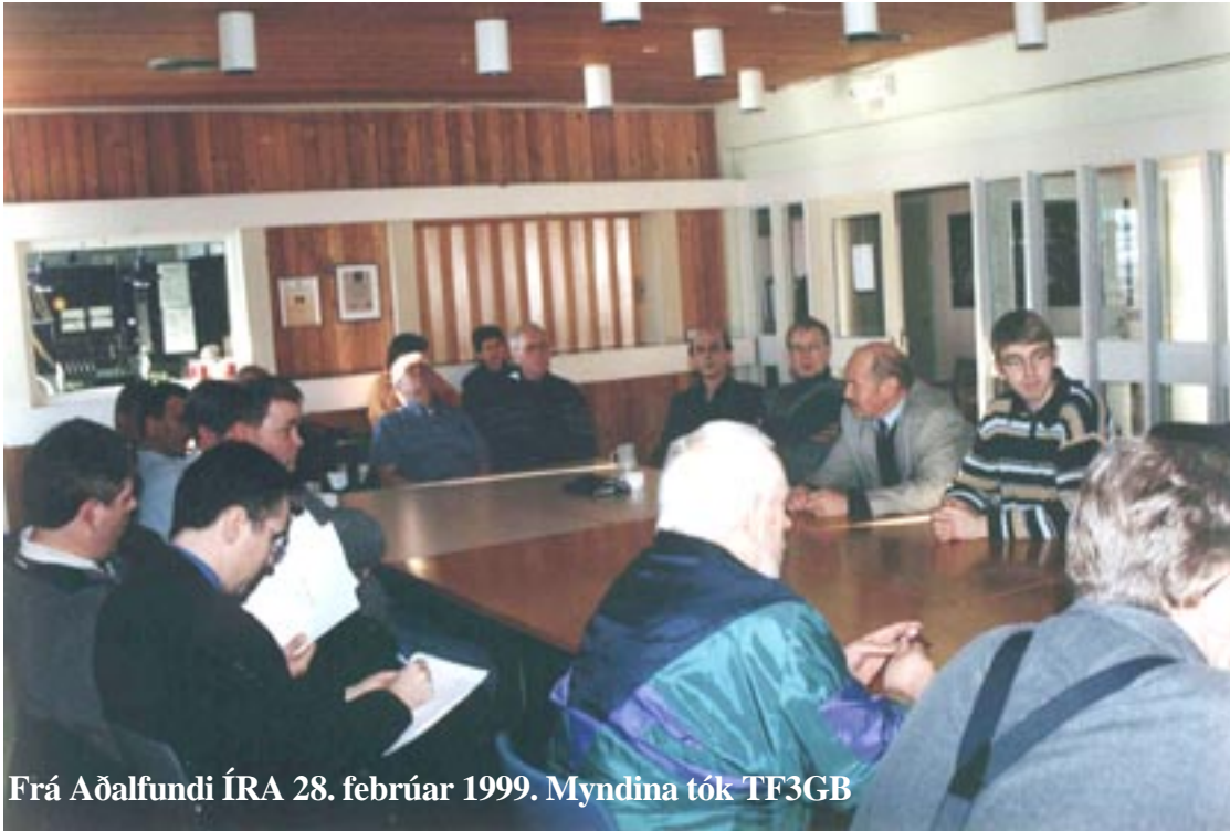
Frá Aðalfundi ÍRA 28. febrúar 1999.

Spjaldskrárritari Bjarni Sverrisson TF3GB