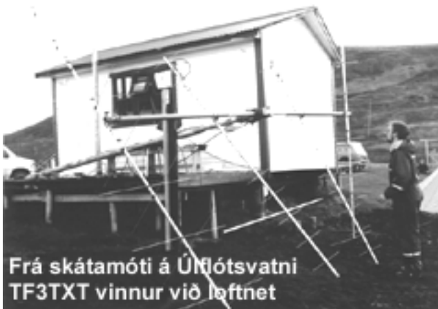
Frá skátamóti á Úlfhljótsvatni TF3TXT vinnur við loftnet

Á JOTA í fyrra vakti packetið gífurlega athygli hjá krökkunum, þetta er í þeirra augum annað form af IRCinu sem er að tröllríða Internetinu. Að minnsta kosti tvær tölvur verða í packet viðskiptum innan svæðis á mótinu. Það verður því gaman að fylgjast með krökkunum í packetinu.