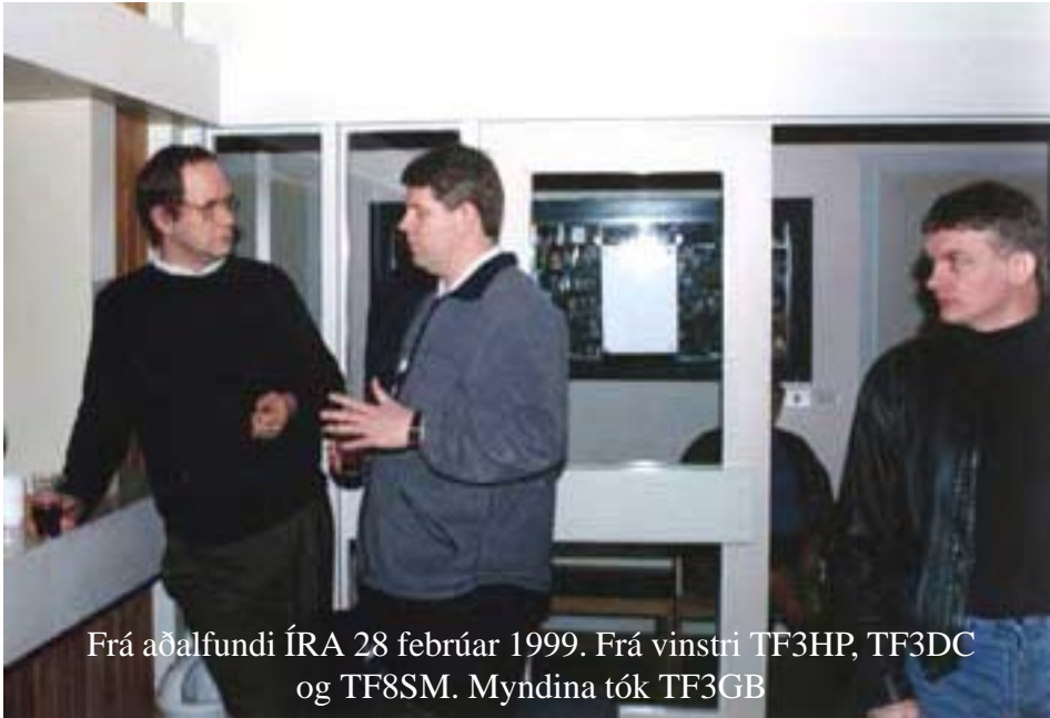
Frá aðalfundi ÍRA 28 febrúar 1999. Frá vinstri TF3HP, TF3DC og TF8SM.

Guðjón að i n n h e i m t a félagsgjalda hefði sjaldan verið jafn góð eins og síðast ár. TF8GX, sagðist sjá það í reikningum félagsins að enn hafi félagið ekki greitt fyrir HF s t ö ð i n a . T F 3 W O T svaraði því og sagði að f é l a g i ð