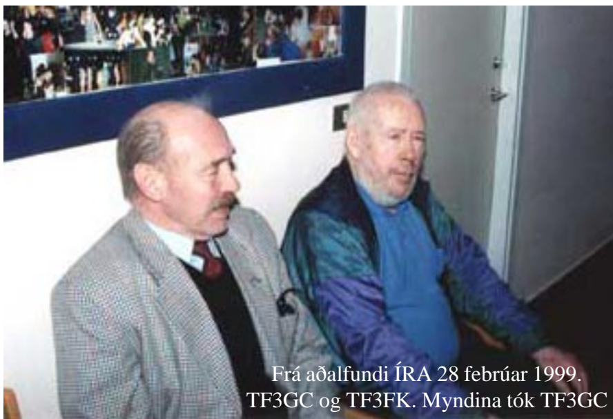
Frá aðalfundi ÍRA 28 febrúar 1999. TF3GC og TF3FK.