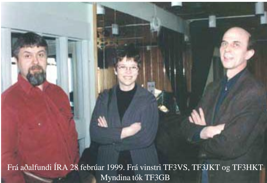
Frá aðalfundi ÍRA 28 febrúar 1999. Frá vinstri TF3VS, TF3JKT og TF3HKT

TF3HP bætti við skýrsluna nýjustu fréttum af störfum pr ó f a - nefndar að r e g l u - gerðar - málum. Sagði hann að talsvert starf hafi þegar verið unnið, en prófanefnd hafi beðið um frest til að fullgera s í n a r tillögur.