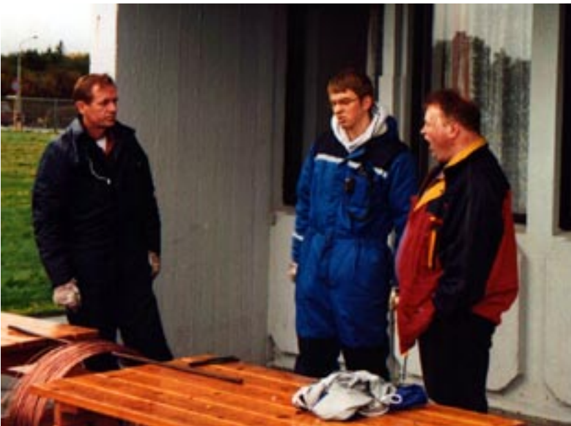
Þessir eilífu verkfundir geta verið þreytandi