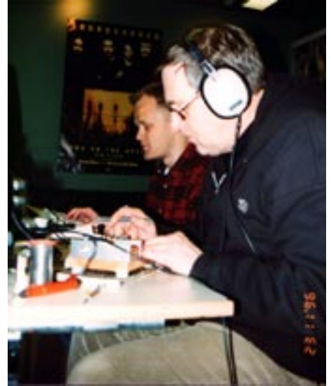
Á fullu í contest