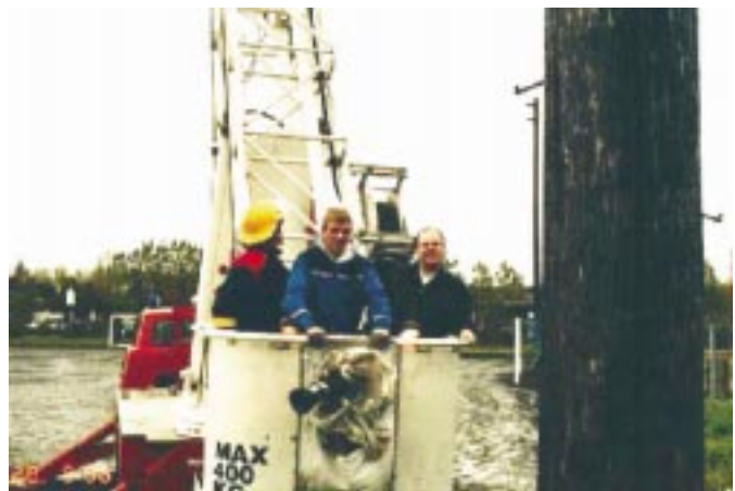
Ungir menn á uppleið. TF3RJT og TF3GW við loftnetauppsætningar við Þróttheima.