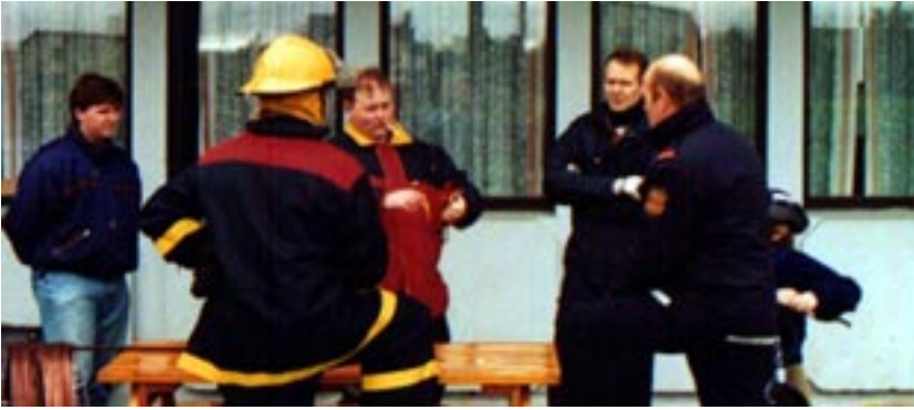
Verk fundur við loftnetsuppsetningu við Þróttheima