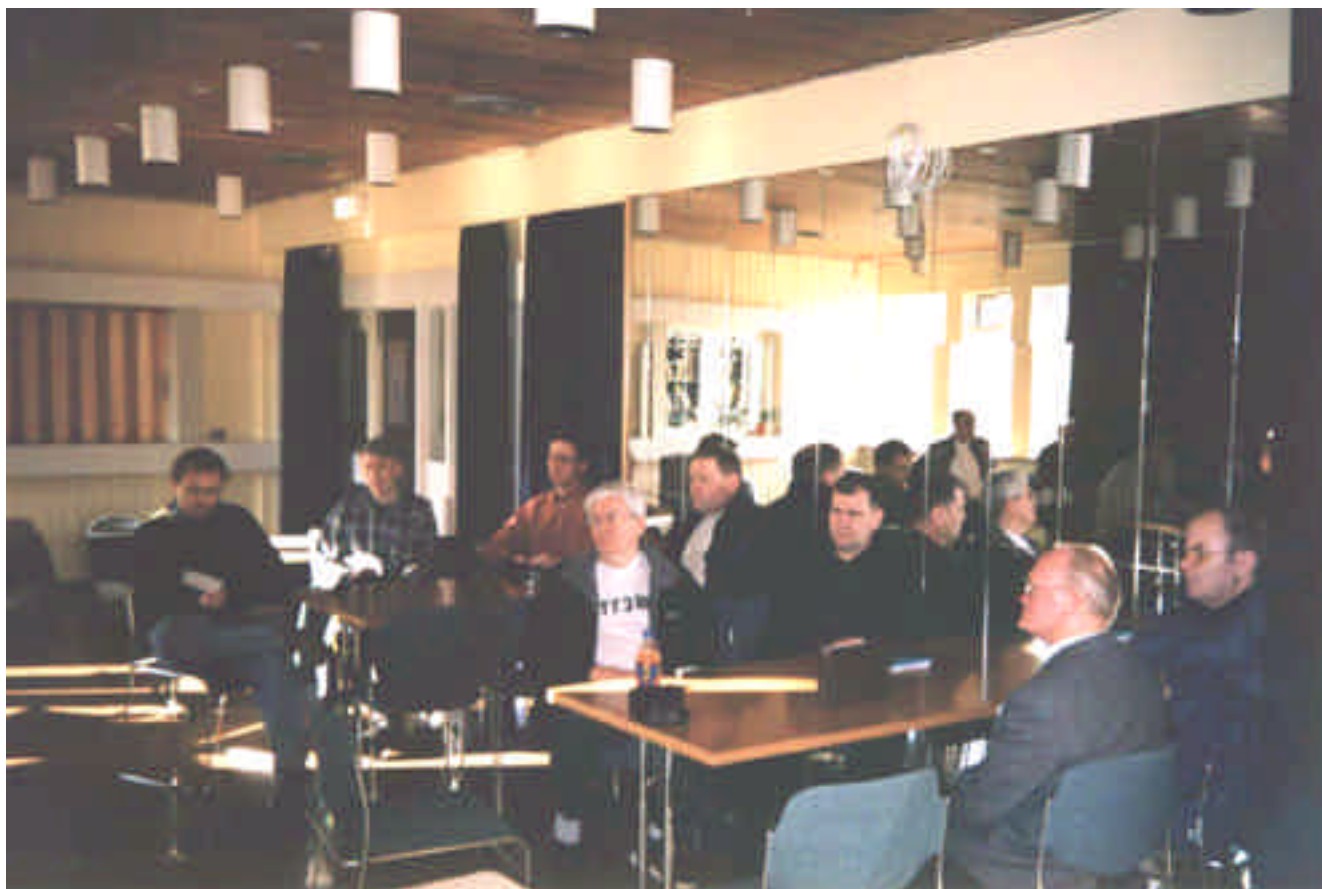
Frá vinstri: TF3KX, TF3LA, TF3AO, TF3BM, TF3VET, TF3JA, TF5BG og TF3GW.