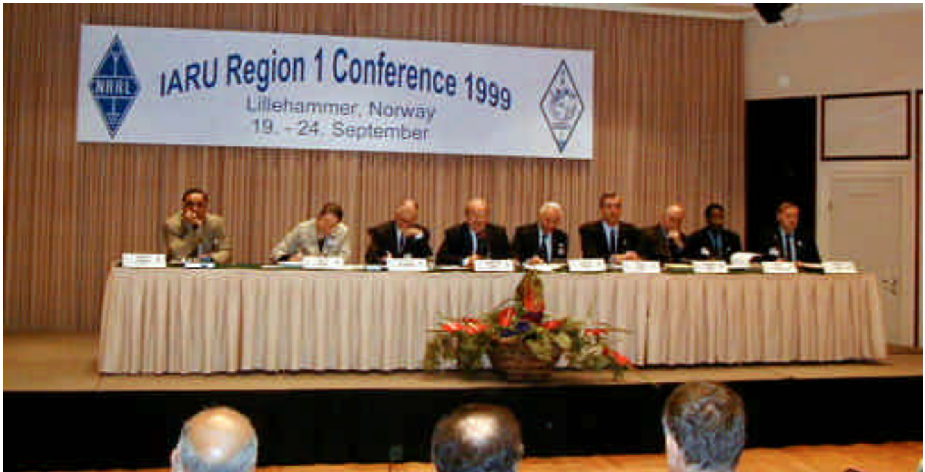
Fráfarandi stjórn IARU Region 1.

stuttlega minnst á S25 og M-XXX, sem ber á góma í sumum viðtölunum. S25 er sú grein alþjóðaradíóreglugerðar ITU, sem fjallar um amatörradíóþjónustuna ( http://www.itu.int/radioclub/rr/arts25.htm ) og S25.5 er sú grein, sem fjallar um mors sem kröfu fyrir tíðnum undir 30 MHz. Til að gera langt mál stutt um hvernig fjallað var um