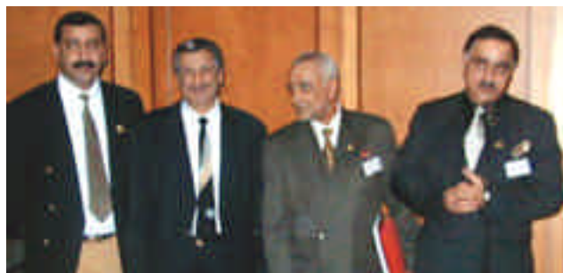
A-4 gengið A41KG,A41LZ,A41KB,A41JT